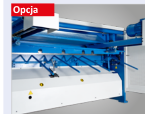
Pneumatyczne podtrzymanie arkusza blachy