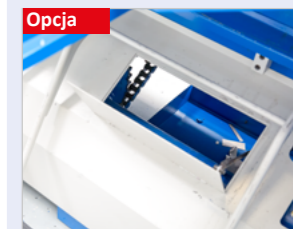
Chwytnak małych części