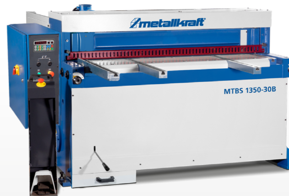
MTBS 1350-30 B (z opcjonalnym chwytakiem i szufladą)