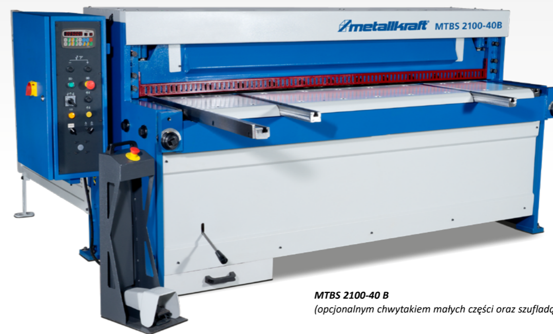
MTBS 2100-40 B (opcjonalnym chwytakiem małych części oraz szufladą)