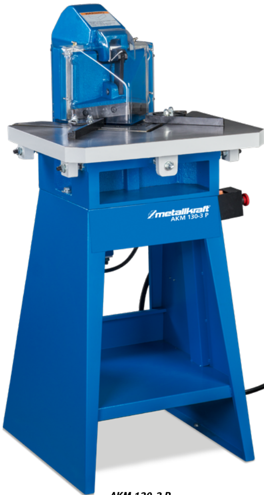
AKM 130-3 P