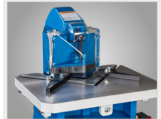
▶ Plexiglasowa osłona na palce