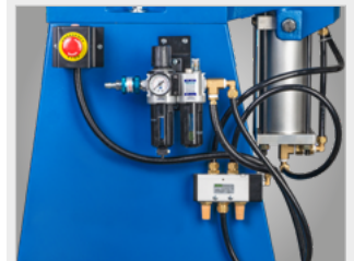
▶ Jednostka konserwacyjna dla pneumatyki