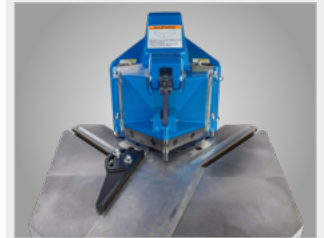
▶ Prowadnica z regulacją kątową