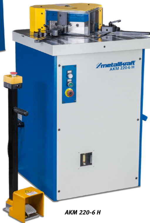
AKM 220-6 H