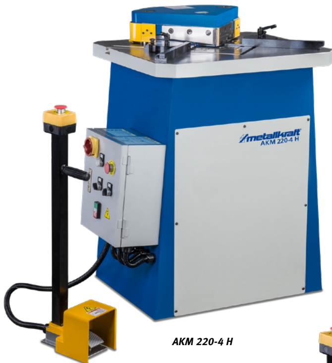
AKM 220-4 H