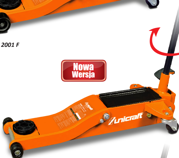
SRWH 2001 LF