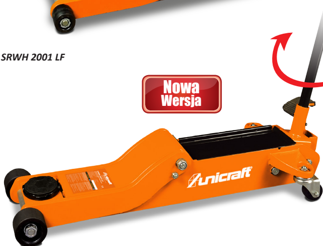
SRWH 3001 LF