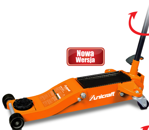
SRWH 2001 F