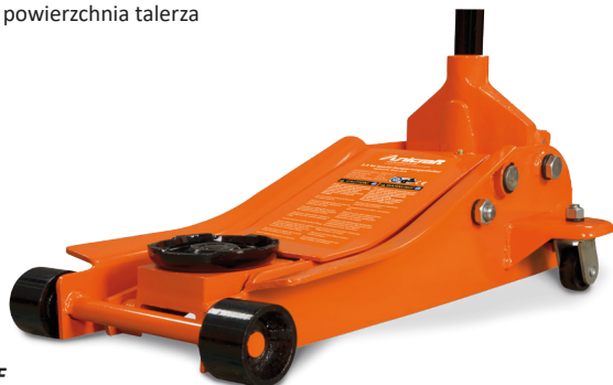
SRWH 2500 EF