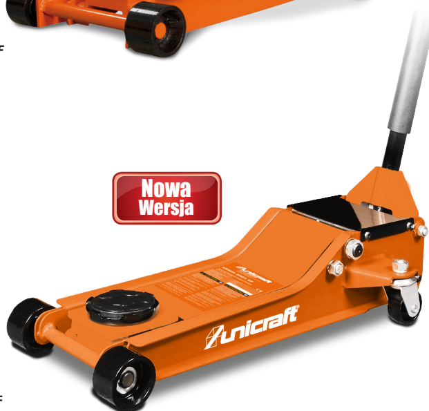
SRWH 3001 EF