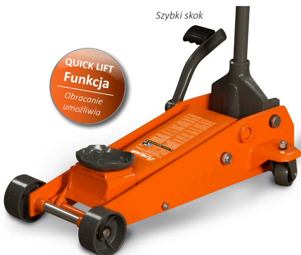
SRWH 3000 QL