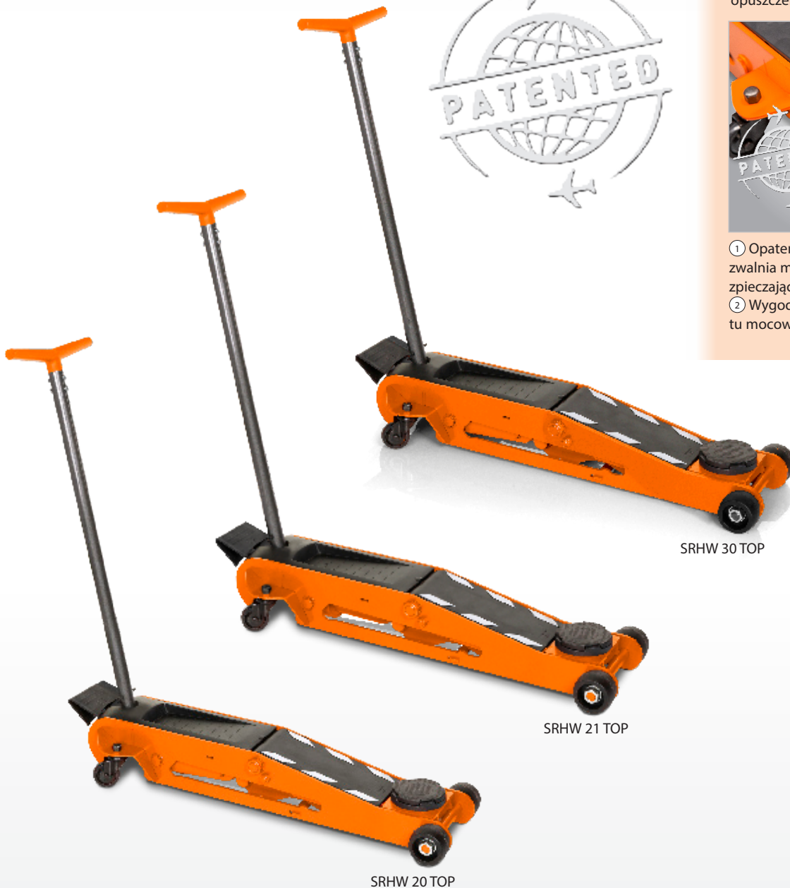
SRHW 30 TOP