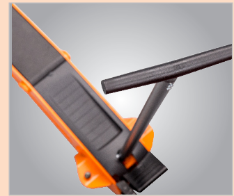
Mechaniczny system zabezpieczający zapobiega przypadkowemu opuszczeniu