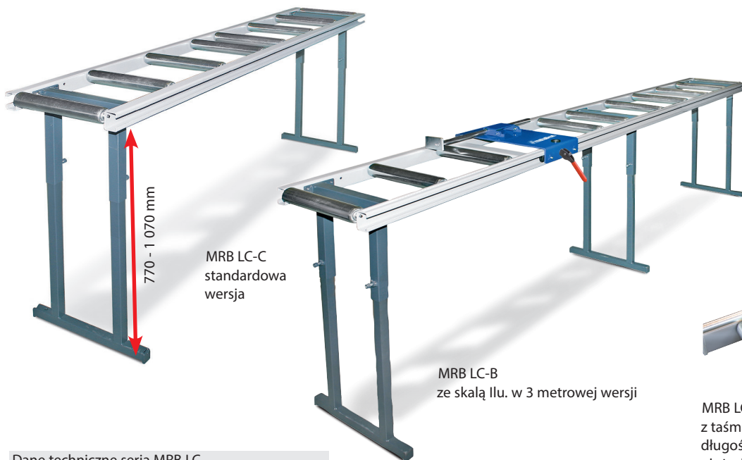
MRB LC-C standardowa wersja

MRB LC-B: z seryjną lupą ułatwiającą odczyt na skali milimetrowej