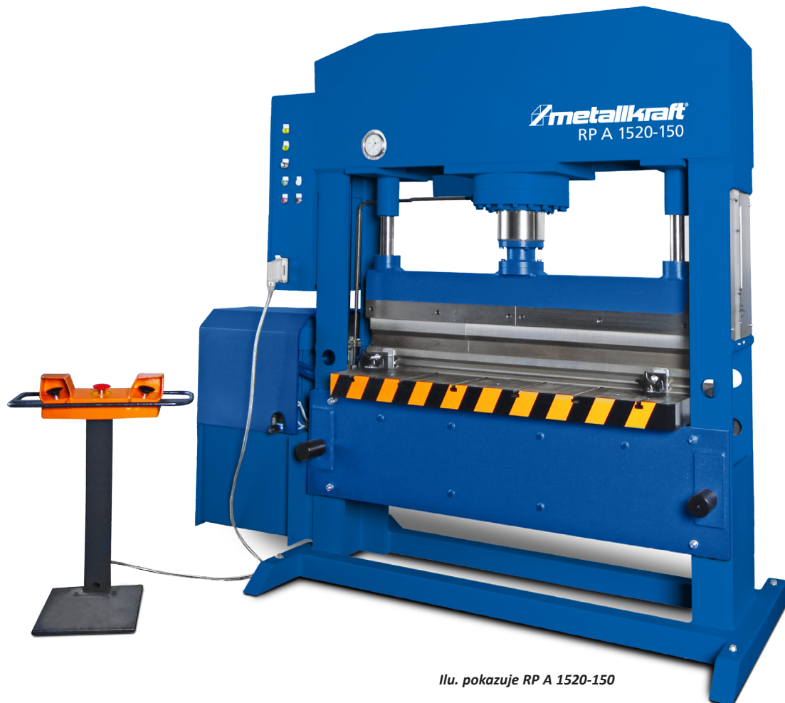
Ilu. pokazuje RP A 1520-150