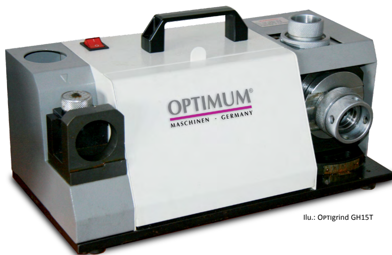
Il.: OPTi grind GH15T