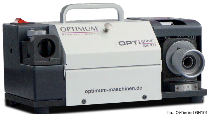
Il.: OPTi grind GH10T