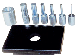
6-częściowy zestaw trzpieni dociskowych z płytą perforowaną, \varnothing 29, 24, 18, 14, 10, 5 mm

Do obróbki materiałów płaskich, wciskania łożysk, sworzni i tym podobnych należy bezwzględnie używać opcjonalnej płyty perforowanej do WPP 15 T, nr art. 4104005.