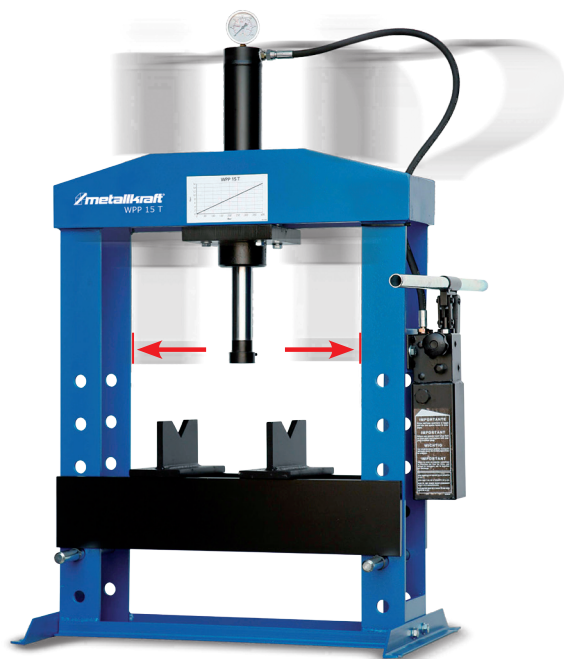
WPP 15 T · prasa stołowa warsztatowa · z dźwignią ręczną