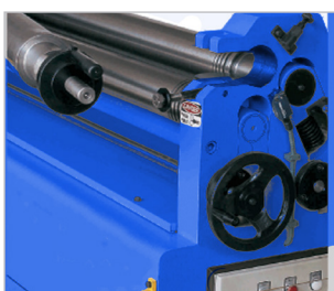
· Wałek górny wychylany

RBM 2050-30 E PRO z opcją silnikowego dosuwania walca bocznego i wskaźnikiem cyfrowym do walca bocznego