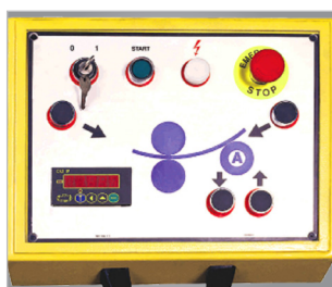
· Panel sterowniczy ze wskaźnikiem cyfrowym i obsługą manualną

Proszę przy zamówieniu podawać obrabiany rodzaj materiału!