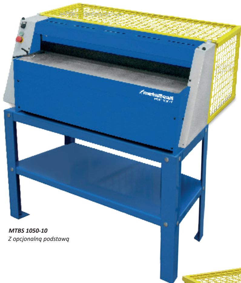
MTBS 1050-10 Z opcjonalną podstawą