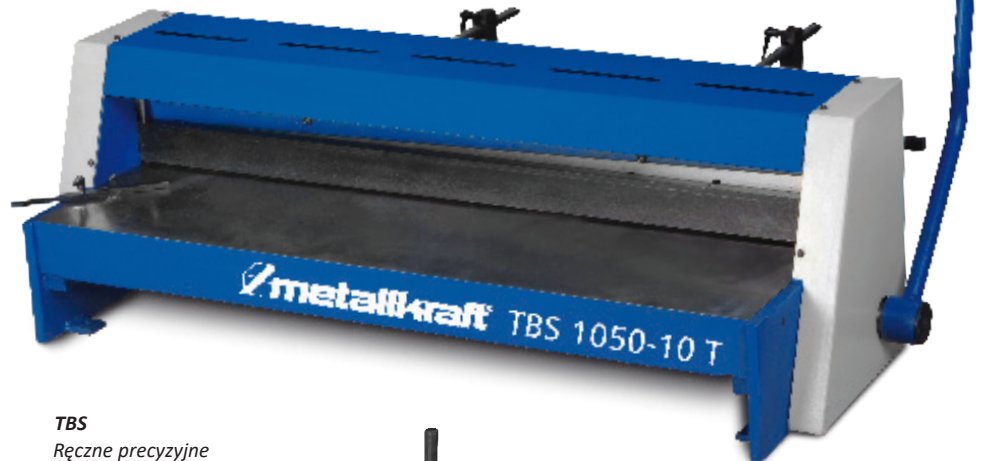
TBS Ręczne precyzyjne nożyce do blachy arkuszowej