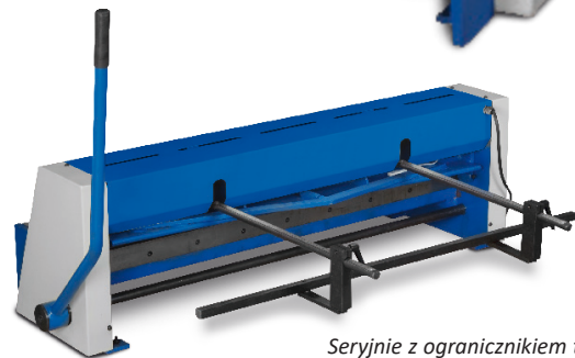
Seryjnie z ogranicznikiem tylnym 500 mm

*Podawana moc odnosi się do materiału o wytrzymałości na rozciąganie 400N/mm 2