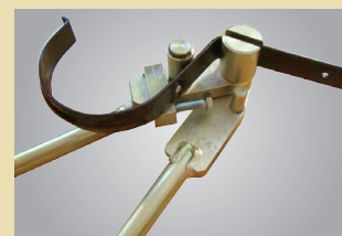
· Przykład zastosowania