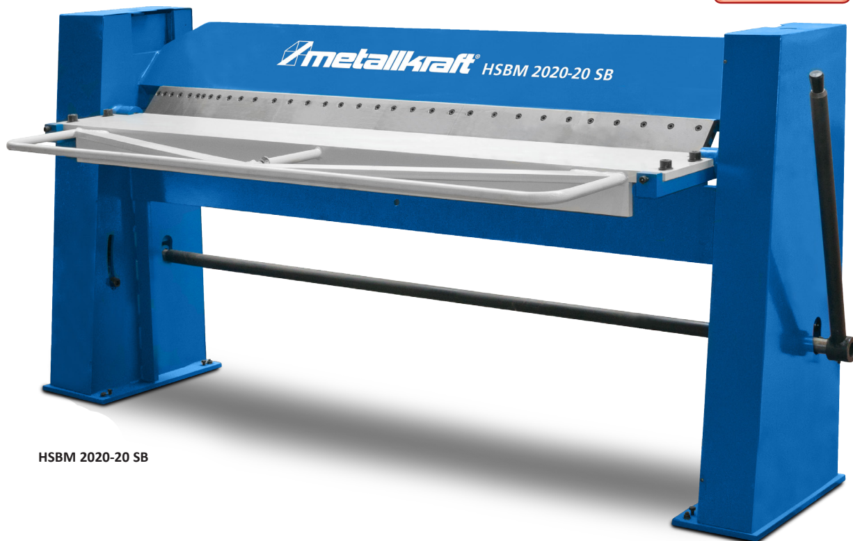
HSBM 2020-20 SB