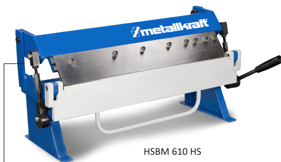
HSBM 610 HS