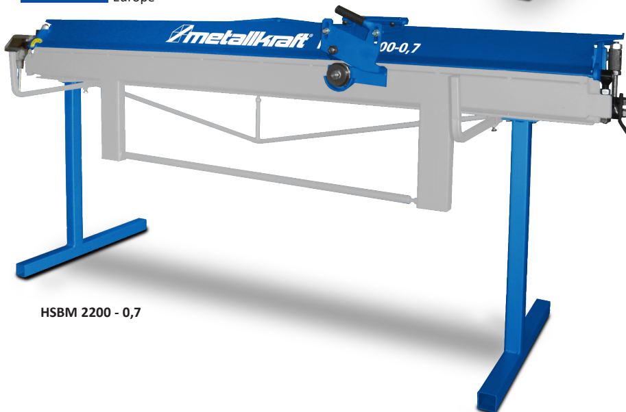
HSBM 2200 - 0,7