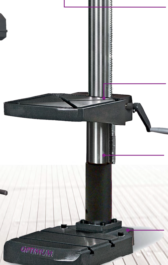
Il.: OPTIdrill DH 40BV