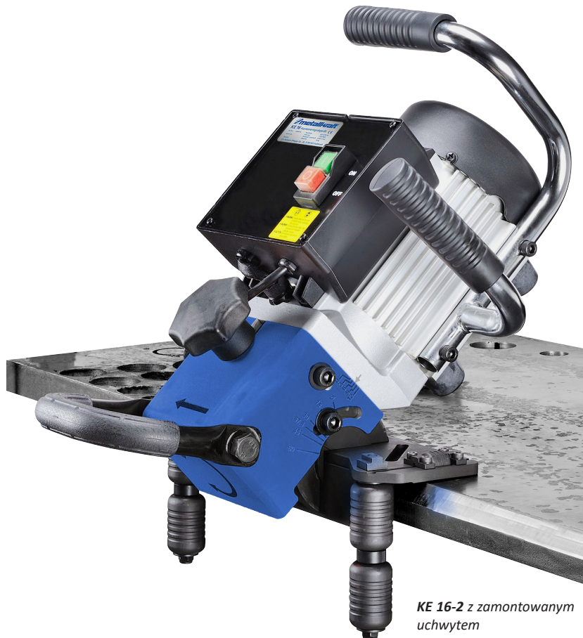
KE 16-2 z zamontowanym uchwytem