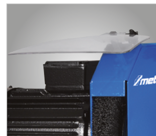
Płyta ochrona dobra widoczność