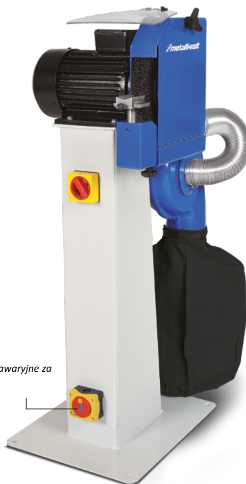
BEG 250 S