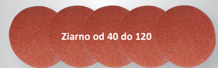
Ziarno od 40 do 120