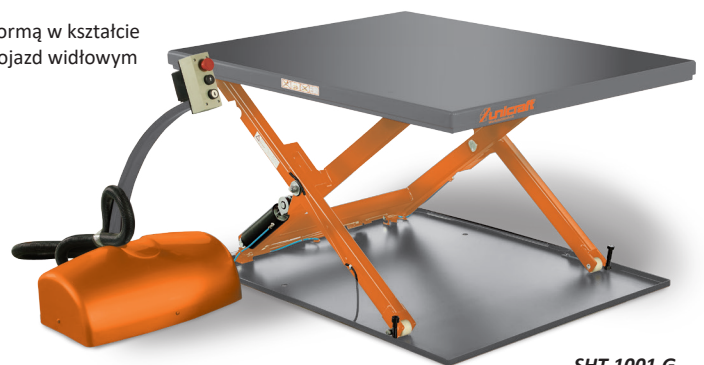
SHT 1001 G