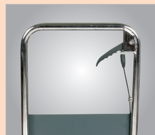
W łatwe i wygodne w obsłudze opuszczanie stołu (FHT 500)