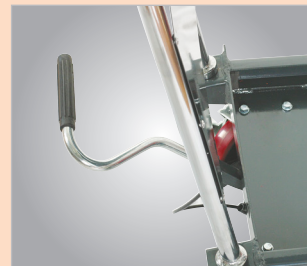
W łatwa w obsłudze hydrauliczna dźwignia nożna (FHT 500)