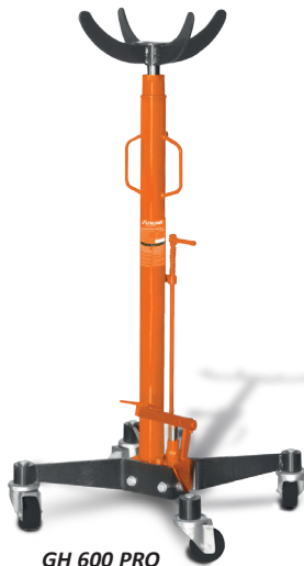
GH 600 PRO