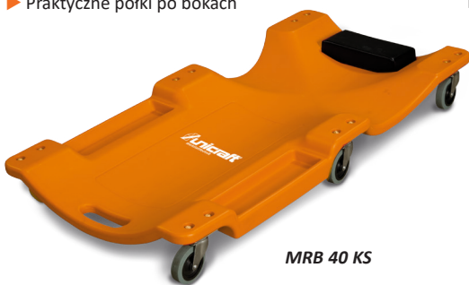
MRB 40 KS