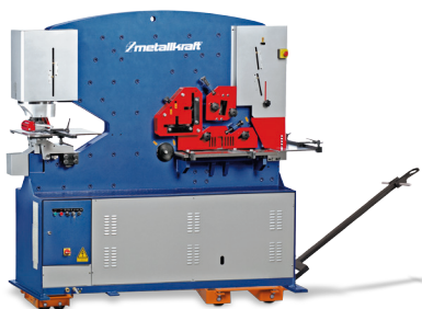
Przykład zastosowania (Maszyna nie należy do zestawu)

▶ Płyty nośne z antypoślizgową powierzchnią