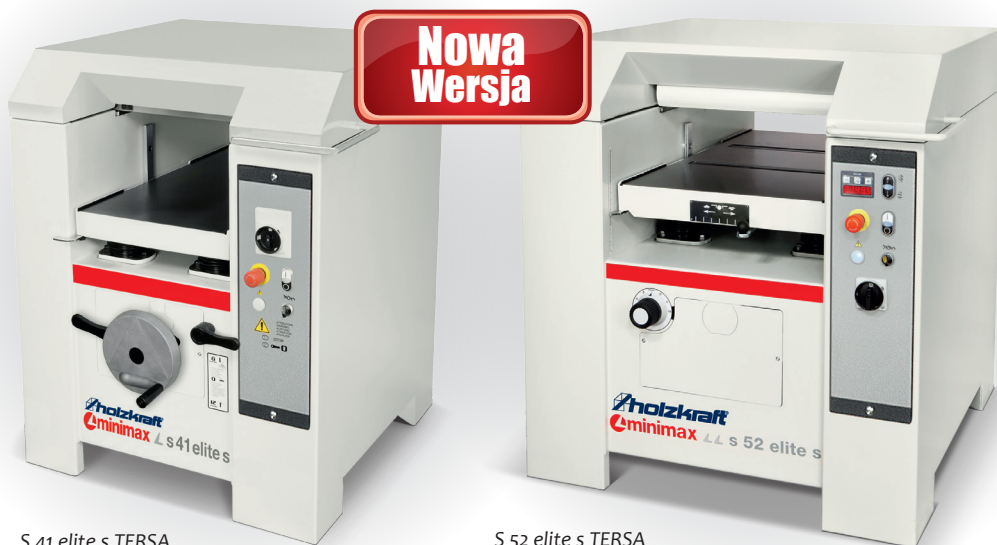
S 41 elite s TERSA