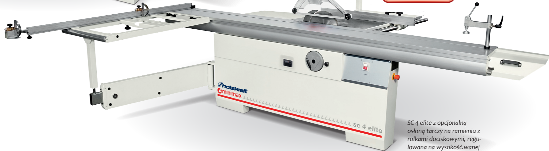
SC 4 elite z opcjonalną osłoną tarczy na ramieniu z rolkami dociskowymi, regulowana na wysokość wanej