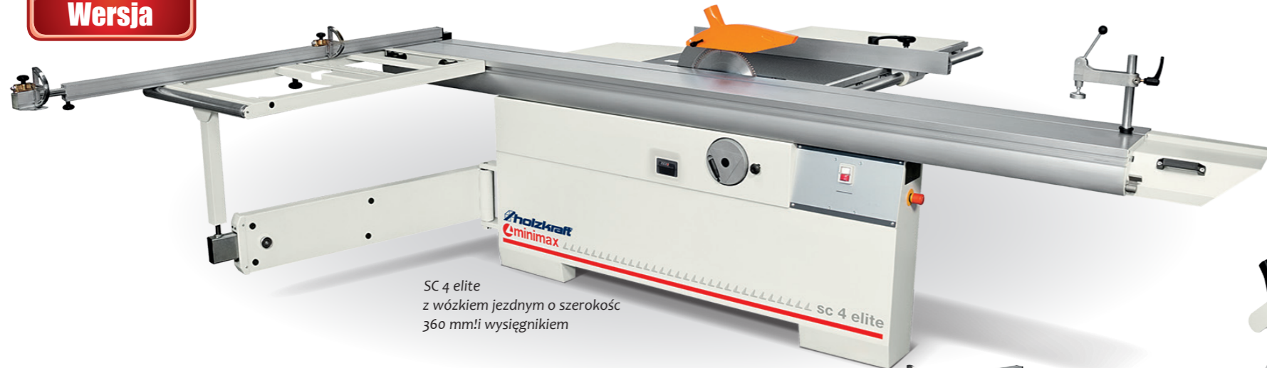
SC 4 elite z wózkiem jezdny o szerokość 360 mm i wysięgnikiem